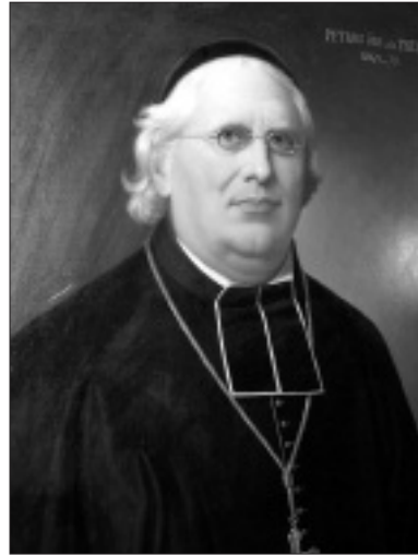
Mgr de Preux, tableau posthume peint par I. Stocker en 1881, Salon d'audience de l'Evêché à Sion.