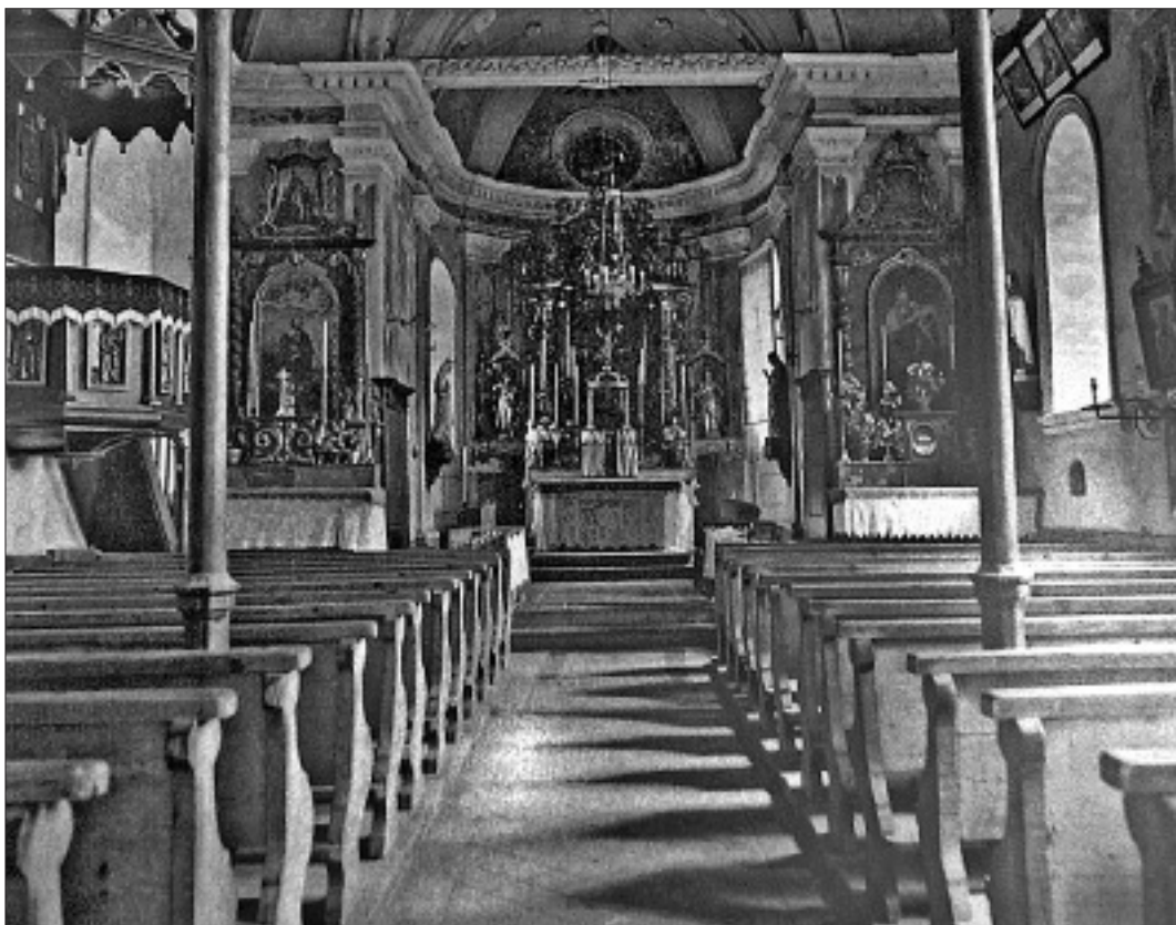
Intérieur de l'ancienne église de Montana construite durant les années 1851 et 1852.

Aussi, l'Evêque consécrateur fait-il trois fois le tour de l'édifice en disant et redisant: Au nom du Père, et du Fils et du Saint Esprit; et pourquoi? C'est pour en prendre possession solennelle au nom de l'auguste trinité divine.