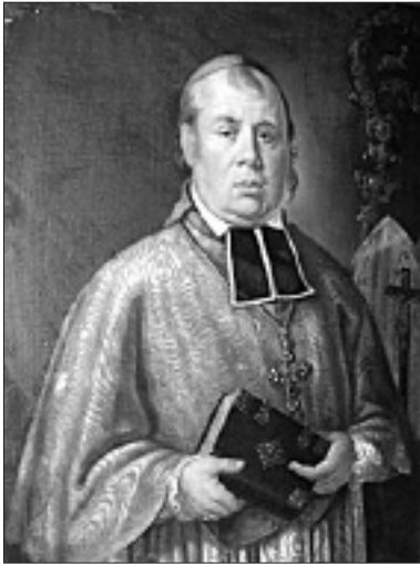
Mgr de Preux, tableau peint par Laurent Justin Ritz en 1850, Couvent des Capucins à Sion.