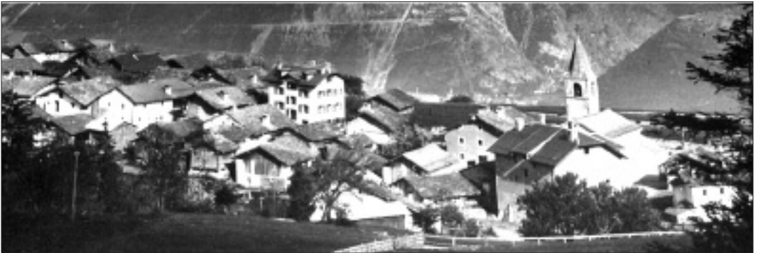
Le village de Montana dans les années 1930 autour de son église, édifice construit en 1851 et 1852 au nord du clocher.

vous était donc la pensée de bâtir une église paroissiale lorsque vous posiez les fondements de cet édifice qui est ici debout devant nous. Vous veniez même de contribuer de bon cœur à la reconstruction de la vaste et belle église paroissiale de Lens et de l'habitation des prêtres attachés à cette église. Mais c'était Dieu par contre qui y pensait parce que, comme le fait le prouve, Dieu avait arrêté dans ses décrets, dans sa bonté, pour vous, que Montana serait paroisse un jour, il voulait faciliter les moyens du salut que la distance de l'église mère, la rigueur de la mauvaise saison sur cette hauteur surtout, et parfois la rigueur du chemin, rendaient bien difficiles et toujours trop rares pour la ferveur de votre piété. (...)