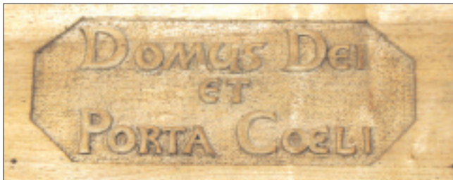
L'inscription Domus Dei et Porta Coeli figurant sur la porte d'entrée de l'église actuelle, formule très souvent reprise par l'évêque de Preux.

comprenez, Chers Frères, que c'est là une manière de parler, une expression métaphorique et figurée, mais dont vous saisissez de prime abord le sens propre et réel; sens qui n'est autre que celui-ci, que cet édifice par sa consécration deviendra pour vous un moyen efficace de salut, la voie pour arriver au Ciel; que c'est en lui que vous trouverez l'entrée du Ciel; et comment cela? (...)