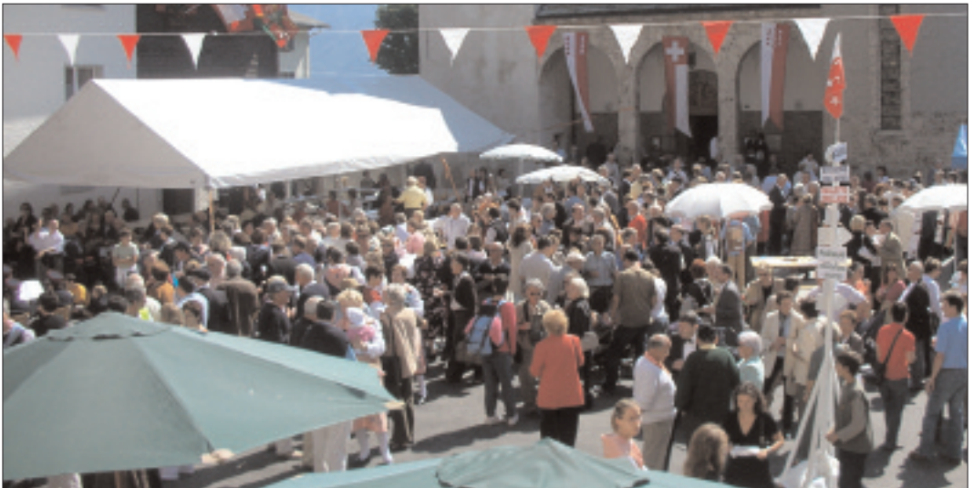
Fête après la consécration de l'autel de l'église rénovée: Montana, le 2 septembre 2007.

Après de longs mois de travaux de rénovation, l'église paroissiale St-Grat de Montana a été rendue aux fidèles lors de la cérémonie du 2 septembre 2007. En écho à cette inauguration et à la plaquette souvenir publiée à cette occasion, L'Encoche propose des extraits de l'enseignement de l'évêque Pierre-Joseph de Preux lors de la consécration de l'église paroissiale de Montana le 19 septembre 1868. Cette église, démolie en 1935 à l'exception du clocher, a laissé place à l'édifice actuel, reconstruit la même année sur l'emplacement du cimetière de la première église.