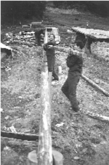
Lors d'un exercice P.C.i.