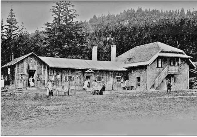
Le premier Café du Centre.