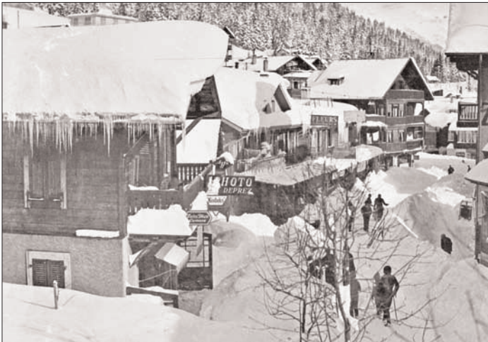
Le chalet «Photo Deprez» situé à l'endroit de l'actuel magasin.

A cette époque, la mode est aux photos de famille. Le matériel photographique ne s'est pas encore démocratisé. Seuls les professionnels en possèdent. Tant les familles au grand complet que les entreprises ou les sociétés locales aiment à poser pour immortaliser de grands événements. Les poses sont classiques, les personnes du premier rang assises sur des chaises et celles du deuxième rang sur les marches d'un bâtiment ou sur un banc. Chacun se met évidemment sur son trente-et-un.