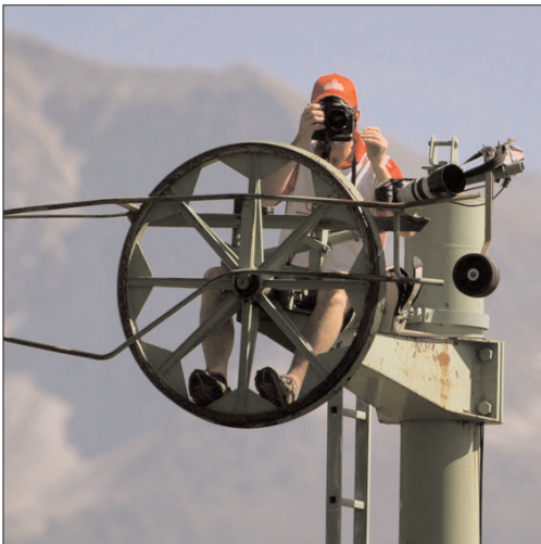
Hervé Deprez, dans ses œuvres.

Hervé Deprez, troisième génération des Deprez photographes à Crans-Montana, ne peut plus compter sur une clientèle nombreuse pour acheter les seuls appareils de photo. Toutefois, le marché des accessoires, certains articles de nettoyage, d'optique, les batteries, les cartes mémoire, les sacs sont toujours recherchés par les touristes de passage ou les habitants de Crans-Montana. À côté du matériel lié à la prise de vue, Hervé Deprez effectue encore les tirages des photos numériques qu'on lui demande. Une forme d'artisanat perdue avec les tirages aux formats spéciaux, comme des panoramas par exemple, pour lesquels des cadres sur mesure sont confectionnés par des menuisiers.